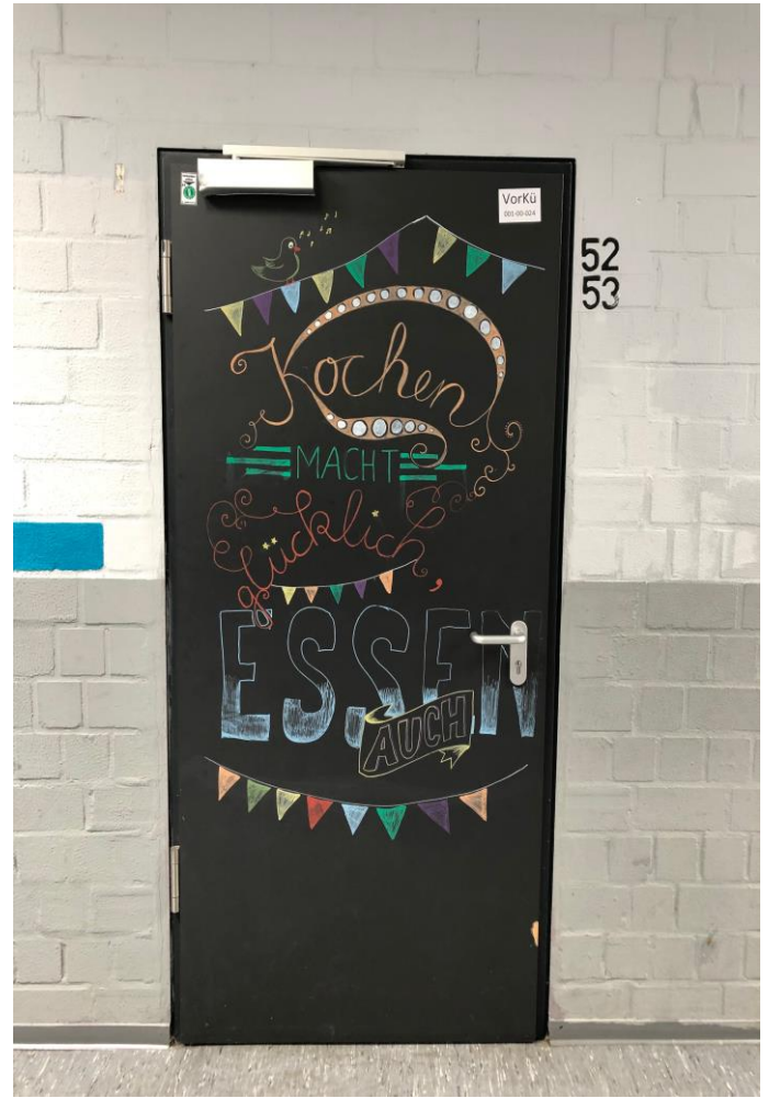
4. Raum 52 und 53 sind zusammen unsere große Küche, in der man im Nachmittagsunterricht kochen kann.