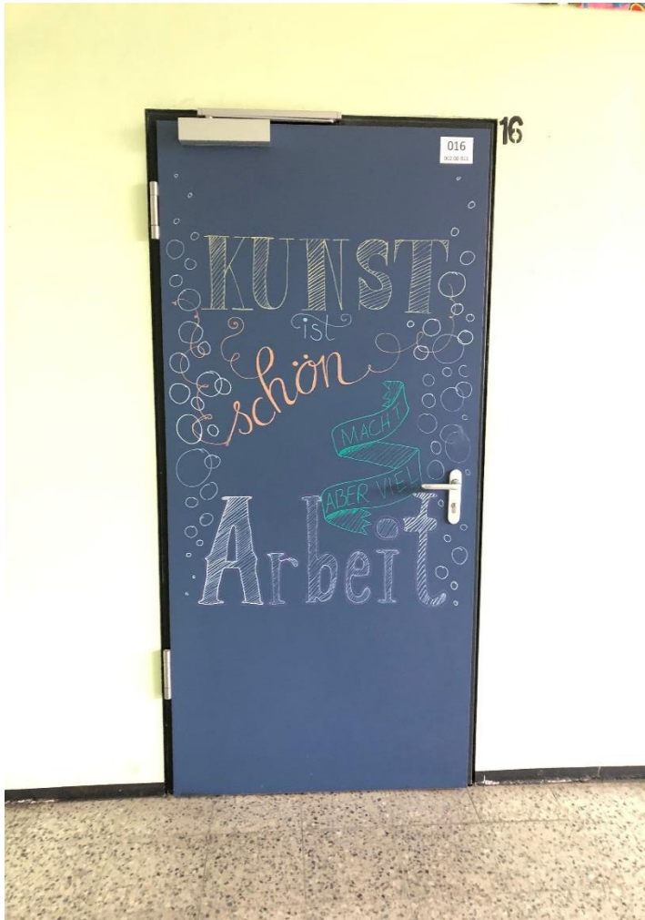
1. Raum 16 ist der „Chillraum“, den man in den Pausen besuchen kann.

Seit kurzem gibt es auf unserer Schule Wallart zu finden: Die Türen und Wände wurden in verschiedenen Bereichen künstlerisch gestaltet. Schaut es euch an und denkt dran: Nicht anfassen 😊!