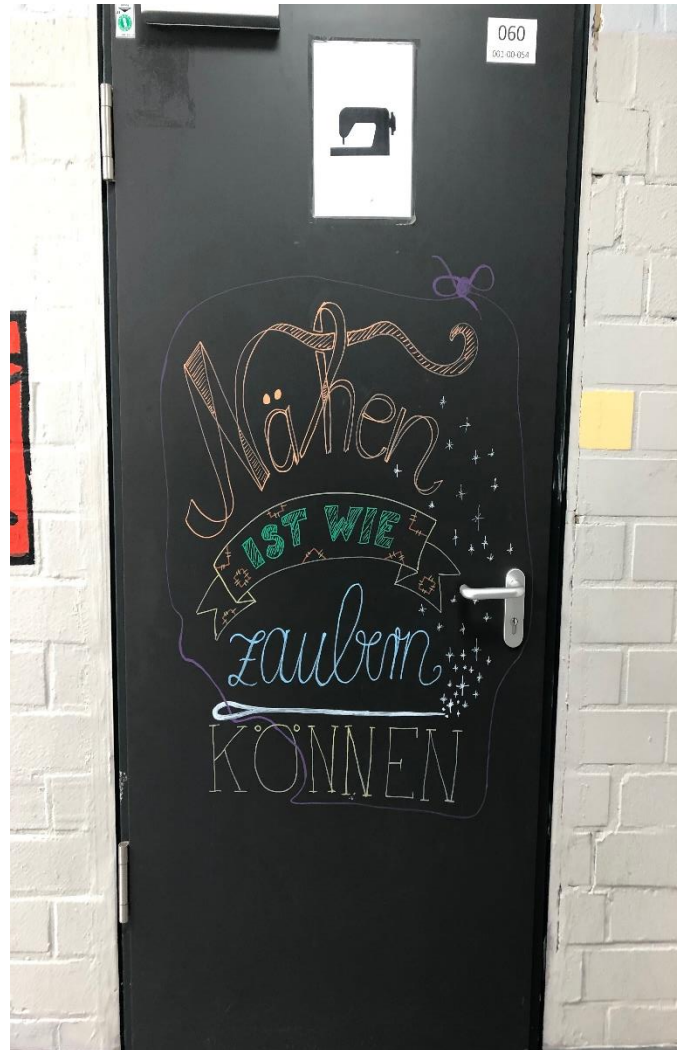
6. Raum 60 ist der Raum, in dem uns die Grundlagen zum Nähen beigebracht werden.