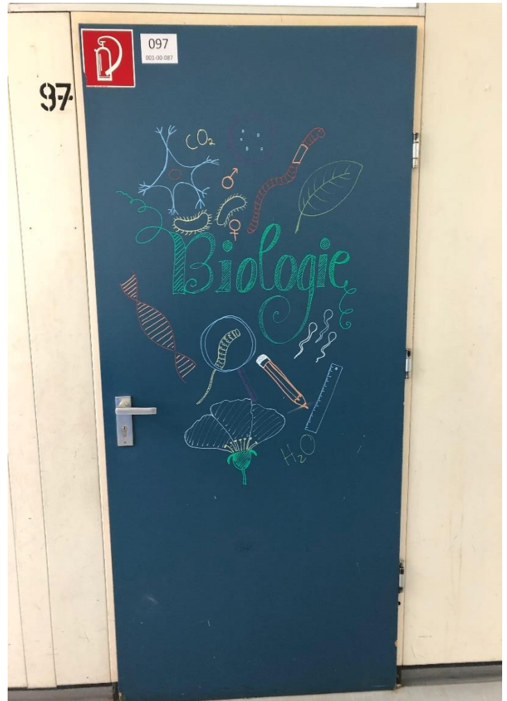
2. Raum 97 ist einer der Bioräume.