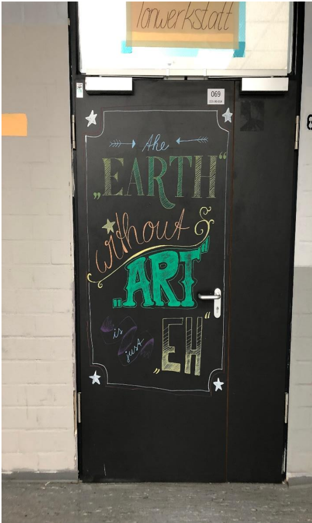
5. Raum 69 ist die Tonwerkstatt, also der Raum, in dem wir unserer Kreativität freien Lauf lassen.